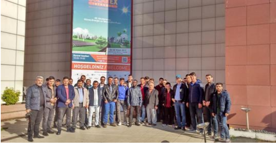
20.05.2017 Karapınar'lılar Kaynaşma Gününde Borsamız Stant Açtı