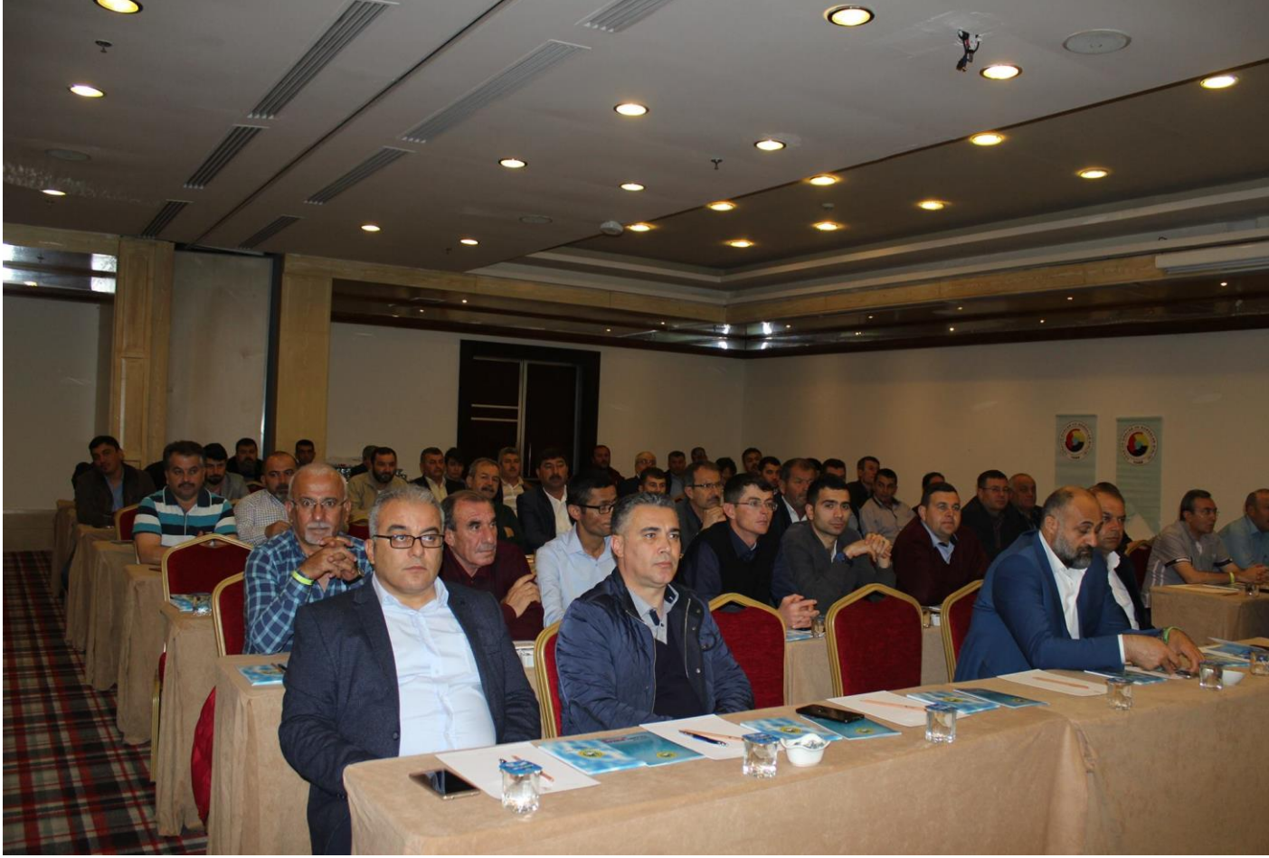
08.04.2017 İstanbul 10.Uluslararası Güneş Enerjisi ve Teknolojileri Fuarına giriş yaptık